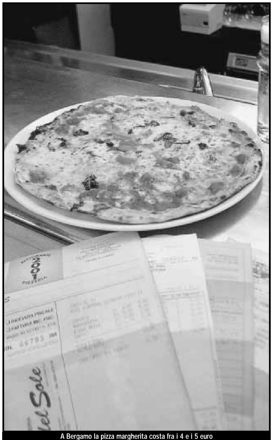
A Bergamo la pizza margherita costa fra i 4 e i 5 euro

Il figlio di «Mimmo»: sogno un posto dove i giovani possano gustare un trancio di napoletana a prezzi stracciati